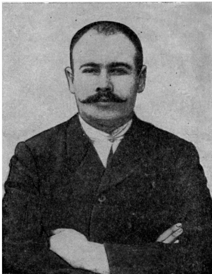
Г. И. КОТОВСКИЙ (фотография 1906 года).