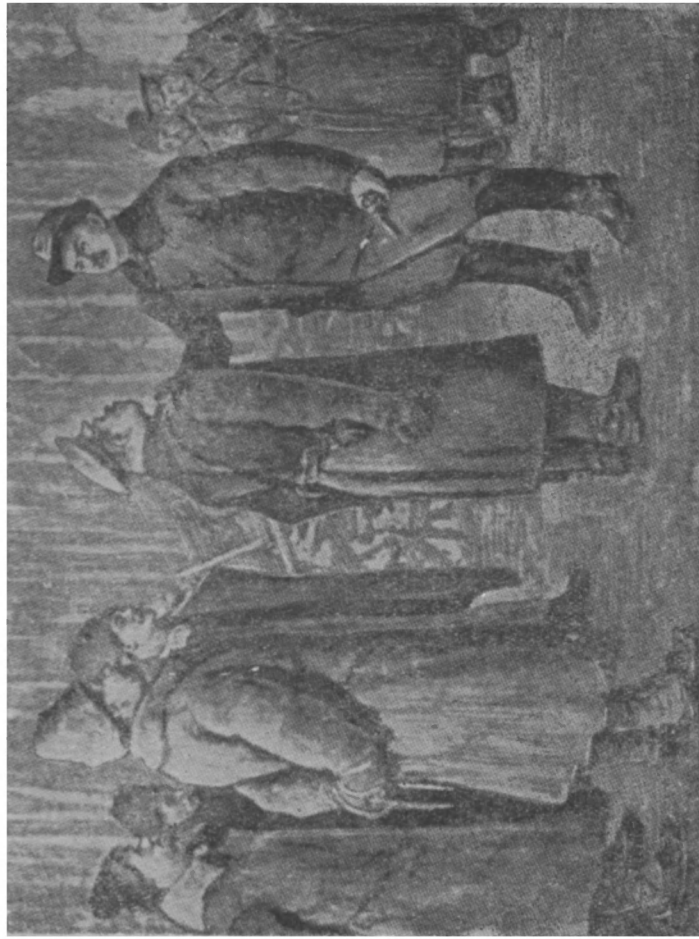
Г. И. Котовский освобождает арестованных крестьян (январь 1906 г.). Худ. П. Мальков.